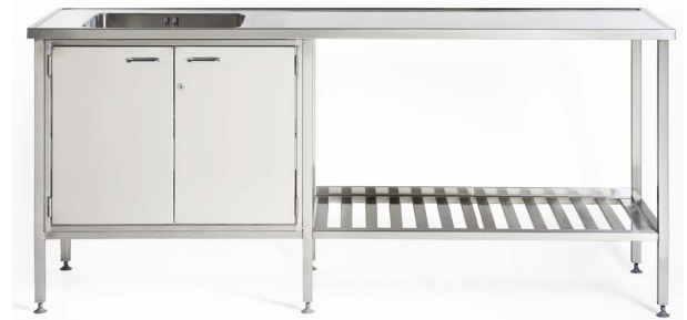
Kuvassa työpöytä, kaapistolla, AT-reunalla, ritilähyllyillä sekä säätöjaloilla.

Alusyksiköllä voit saada helposti lisää säilytys tilaa eri tarpeisiin. Kokonaisuus voidaan täydentää erilaisilla säilytysratkaisuilla, kuten jätuvaunuilla, kaapistoilla tai laatikostoilla, jotka voidaan tarvittaessa varustaa kalustelukoilla.